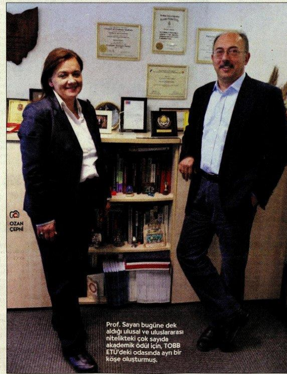
Prof. Sayan bugüne dek aldığı ulusal ve uluslararası akademik ödül için, TOBB ETU'deki odasında ayın bir köşe oluşturmuş.

İran'da hocalığa devam ediyor. Ama kayda değer hiçbir makalesi çıkmamış. İsmi pek bilinmiyordu zaten. Makaleyi