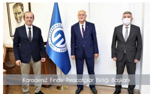
Karadeniz Fındık İhracatçılar Birliği Başkanı