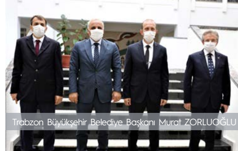
Trabzon Büyükşehir Belediye Başkanı Murat ZORLUOĞLU