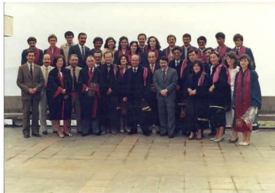
Resim 10. Hacettepe Üniversitesi Trabzon Tıp Fakültesinden naklen gelen öğrencilerin mezuniyet töreni 1985 yılı, Çamlık