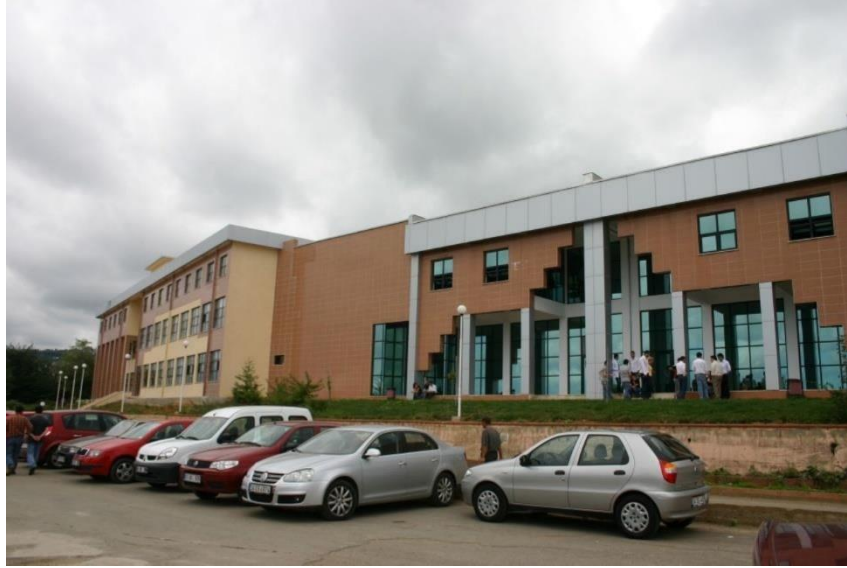
Resim 11. Tıp Fakültesi ek eğitim binası

Diğer yandan tüm dünyada ve Türkiye’de tıp eğitiminin standardizasyonu kapsamında başlatılan akreditasyon çalışmaları 2000’li yıllardan sonra KTÜ Tıp Fakültesinde de başlatılmış ve fakülte mezuniyet öncesi eğitim programı 01 Ocak 2013 tarihi itibarıyla UTEAK tarafından akredite edilmiştir.