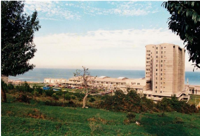
Resim 8. Tıp Fakültesi A-blok ve poliklinikler (1987 yılı)

Eylül 1981'de poliklinik ve günübirlik cerrahi düzeyinde birkaç anabilim dalında başlatılan sağlık hizmetleri, Haziran 1982'den itibaren yatılı hasta hizmetlerinin de eklenmesiyle genişlemeye başlanmış ve 1987'ye kadar, Soğuksu - Çamlık mevkiinde bulunan ve bugün adı Ahi Evren Göğüs Kalp Damar Eğitim Araştırma Hastanesi olarak bilinen binada yürütülmüştür.