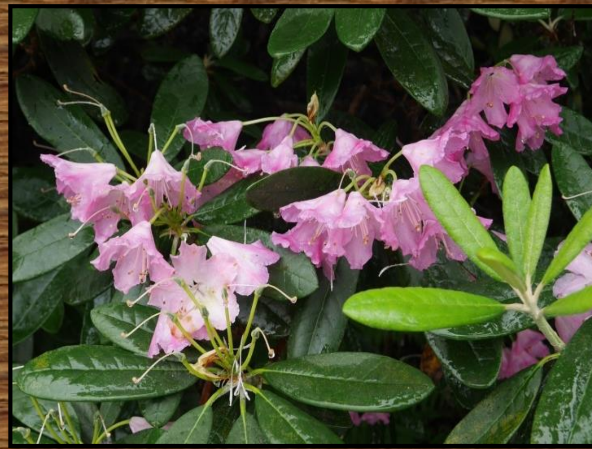
Rhododendron smirnovii (Ender)