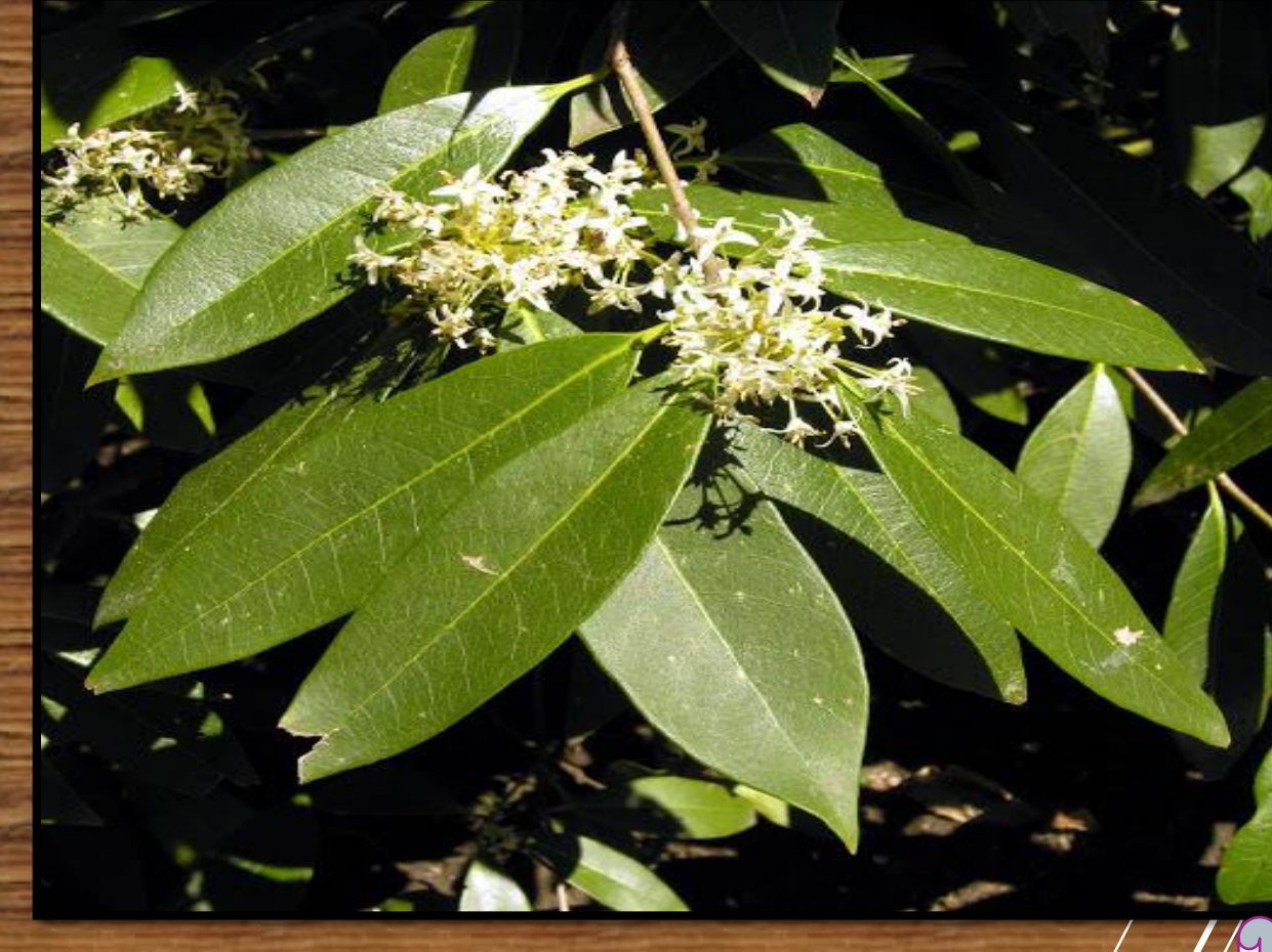
Osmanthus decorus (Ender)