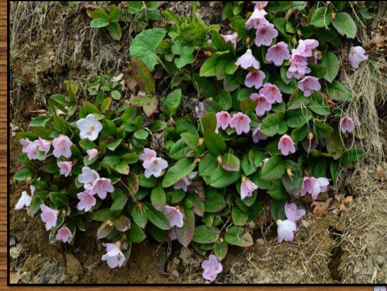
Epigaea gaultherioides (Ender)