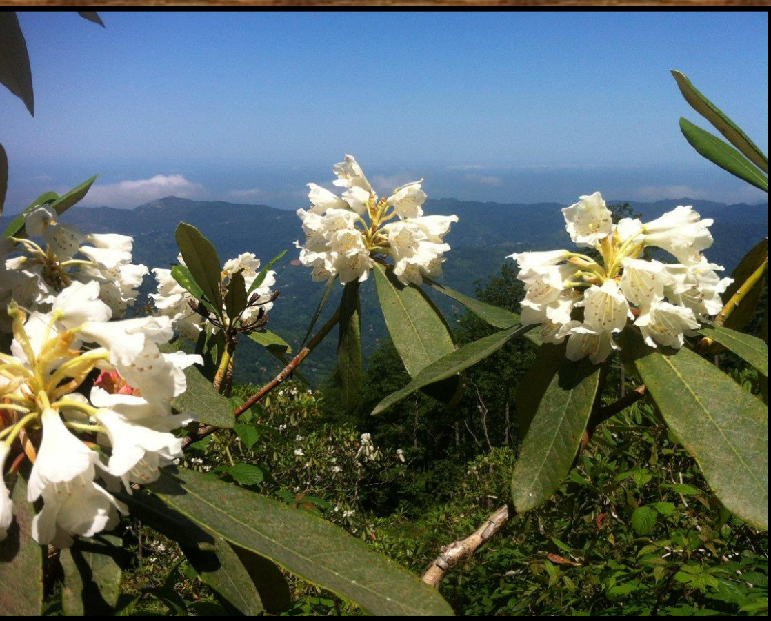
Rhododendron ungueri (Ender)