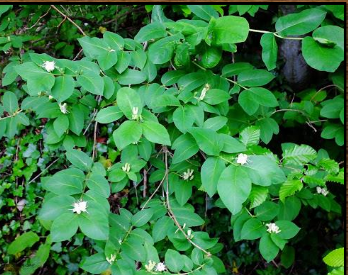
Lonicera orientalis (Endemik)